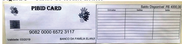
Figura 5 – Cartão de crédito fictício